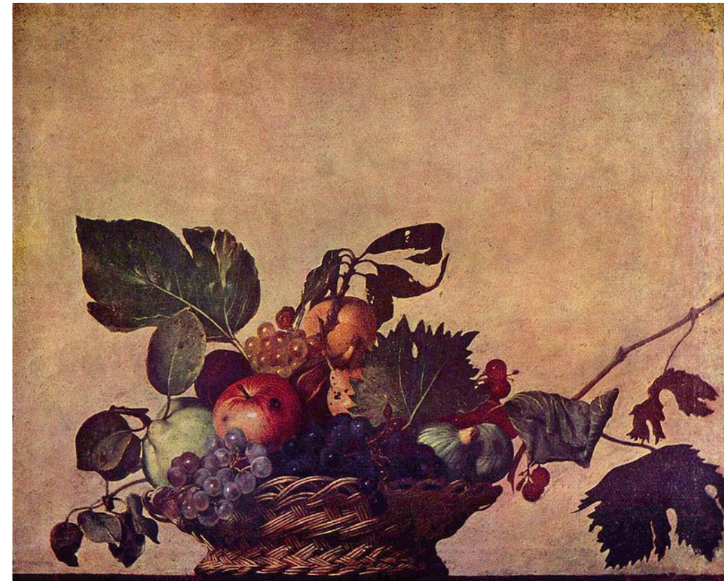
Caravaggio, Canestra di frutta, 1596 circa

La natura morta è una composizione creata da un artista, fatta di frutta e di verdura, ma a volte anche di oggetti e di animali. Una natura morta si può realizzare con tante tecniche diverse. Le nature morte più famose sono disegnate o dipinte.